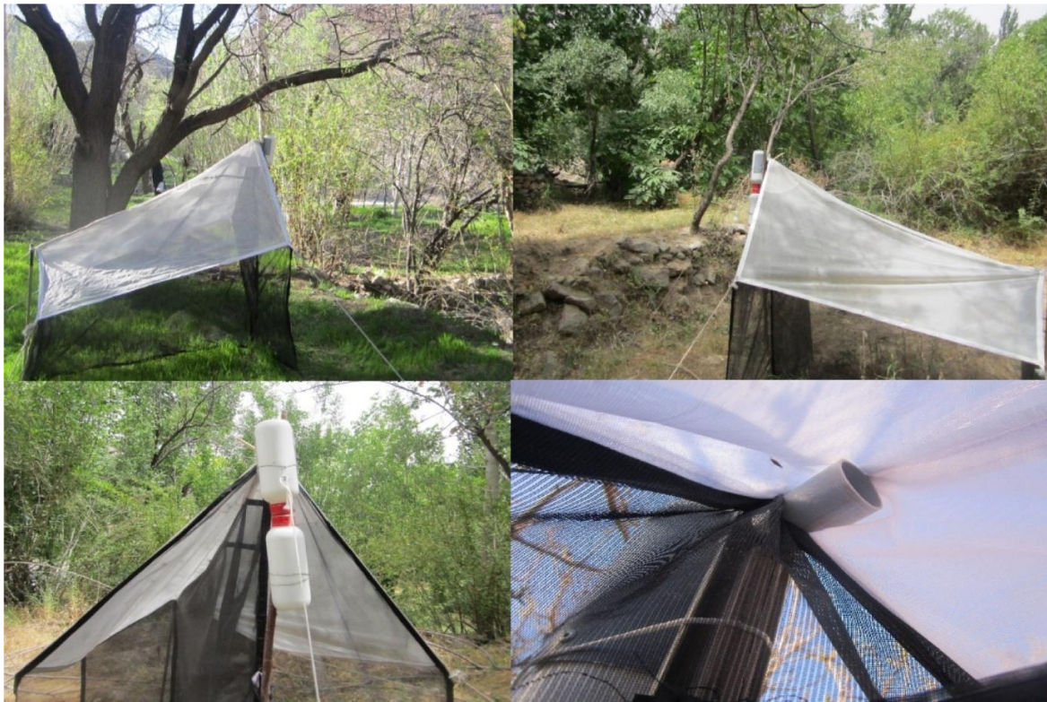
شکل ۲- تله‌های مالیز نصب شده در زیست‌بوم‌های مختلف استان یزد (اصلی)