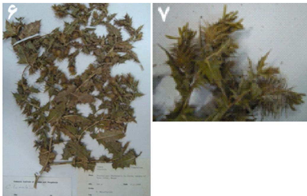
شکل‌های ۶ تا ۷- تصاویر هرباریومی گونه C. lomakinii