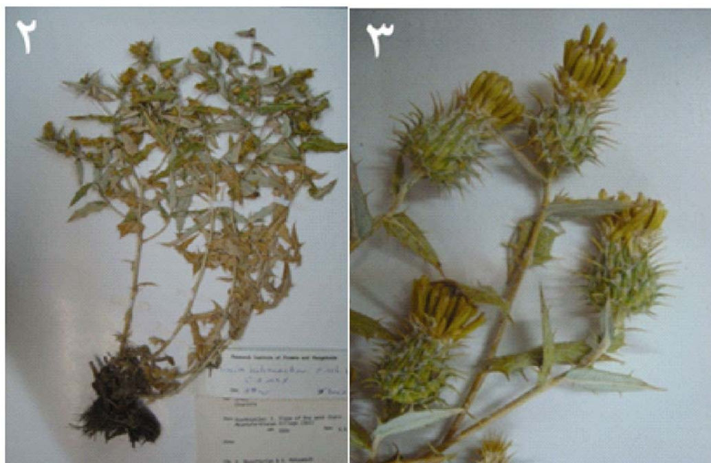
شکل‌های ۲ تا ۳- تصاویر هرباریومی گونه Cousinia hohenackeri Cousinia chlorocephala C.A.Mey. in DC., Prodr. 6: 554 (1838).