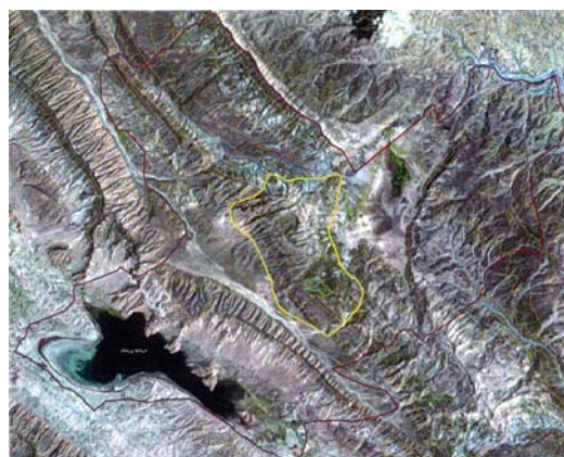
شکل ۲- تصویر هوایی منطقه حفاظت‌شده ارژن-پریشان

تالاب ارژن دارای ارتفاع ۲۰۱۵ متر از سطح دریاهای آزاد و در فاصله ۶۰ کیلومتری غرب شهر شیراز واقع گردیده است. این تالاب دارای اقلیمی نیمه بیابانی تا نیمه مرطوب است. وجود اختلاف ارتفاع در میان این دو تالاب این منطقه را بسیار حائز اهمیت نموده است، به گونه‌ای که تنوع زیستی گیاهان در این منطقه بسیار بالاست و بر اساس نوع اقلیم، انواعی از گونه‌های گیاهی سردسیر و گرمسیر در این ذخیره گاه یافت می‌شوند. شکل ۲ تصویر هوایی ذخیره گاه ارژن-پریشان را نشان می‌دهد.